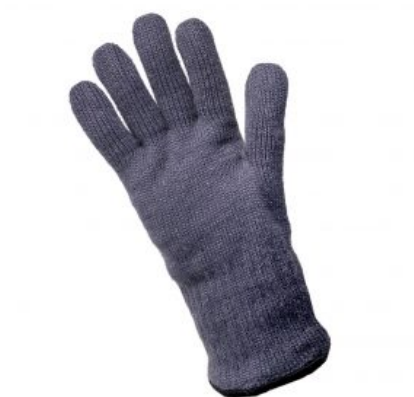
Modelo «Barbacoa Artilan» (ignifugo) RIESGO TÉRMICO EN 407 /Ignífugos Modelo "Barbacoa Artilan" 1241 4242XX - Ignífugo - Anticalórico ... Ver modelo