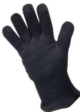
Modelo «Barbacoa Aramid» (ignifugo) RIESGO TÉRMICO EN 407 /Ignífugos Modelo "Barbacoa Aramid" 1241 4342XX - Ignífugo - Anticalórico ... Ver modelo