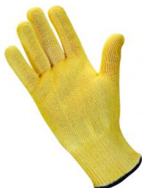
Modelo TG-10 (Ignifugo) RIESGO TÉRMICO EN 407/Ignifugos Modelo "TG-10" 2543 41XXX - Anticorte nivel 5 - Ignífugo - 100°C ... Ver modelo