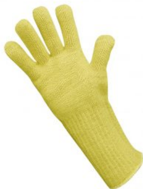
Modelo TGF-7 (ignifugo) RIESGO TÉRMICO EN 407 /Ignifugos Modelo "TGF-7" 254X 4342X - Ignífugo - Anticalórico - 350 °C ... Ver modelo