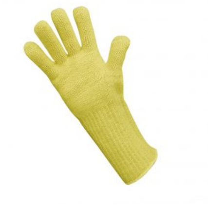
Modelo TGF-7 (ignifugo) RIESGO TÉRMICO EN 407 /Ignifugos Modelo "TGF-7" 254X 4342X - Ignífugo - Anticalórico - 350 °C ... Ver modelo