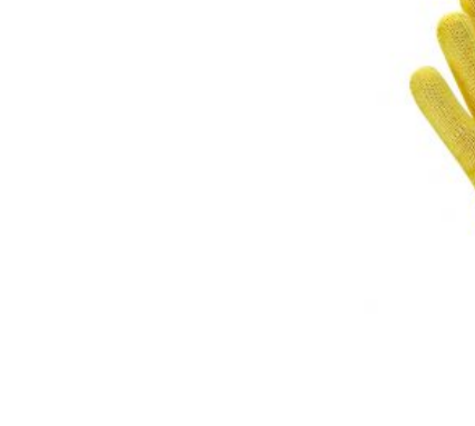
Modelo TG-10 (Ignifugo) RIESGO TÉRMICO EN 407/Ignifugos Modelo "TG-10" 2543 41XXX - Anticorte nivel 5 - Ignífugo - 100°C ... Ver modelo