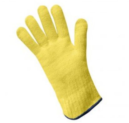
Modelo «Aramid F-R» (ignifugo) RIESGO TÉRMICO EN 407 /Ignífugos Modelo "Aramid F-R" 234X 4342X - Ignífugo - Anticalórico 350 ... Ver modelo