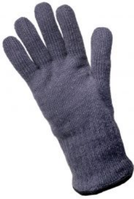
Modelo «Barbacoa Artilan» (ignifugo) RIESGO TÉRMICO EN 407 /Ignífugos Modelo "Barbacoa Artilan" 1241 4242XX - Ignífugo - Anticalórico ... Ver modelo