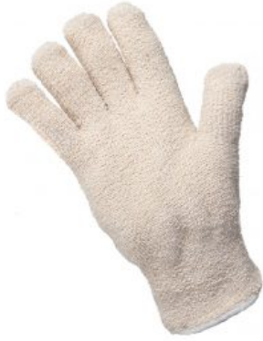
Modelo Rizo puño elástico crudo (Corte 3) RIESGOS MECÁNICOS EN 388 /Corte 3 Modelo "Rizo Puño elástico-crudo" 2341 X1XXX - Rizo gris Nivel ... Ver modelc