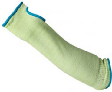
Modelo Manguito Palma 55 cm. (Corte 3) RIESGOS MECÁNICOS EN 388 /Corte 3 Modelo "Manguito Palma 55 cm." 2341 - Manguito 55 cm. largo Nivel ... Ver modelo