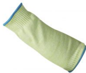
Modelo Manguito 35 cm. (Corte 3) RIESGOS MECÁNICOS EN 388 /Corte 3 Modelo "Manguito 35 cm." 2341 - Manguito 35 cm. largo Nivel corte ... Ver modelo