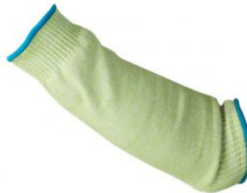
Modelo Manguito 45 cm. (Corte 3) RIESGOS MECÁNICOS EN 388 /Corte 3 Modelo "Manguito 45 cm." 2341 - Manguito 45 cm. largo Nivel corte ... Ver modelo