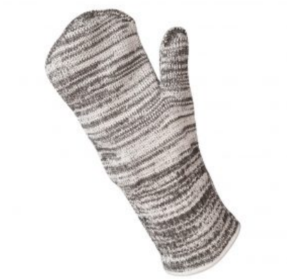
Modelo Manopla 36 cm. (corte 5) RIESGOS MECÁNICOS EN 388 /Corte 5 Modelo "Manopla 36 cm." 1541 X3XXX - Anticorte nivel 5 - Anticalórico - 350°C - 36 cm. largo ... Ver modelo